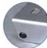
Tapón de ajuste perfecto