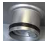
Empaque de ajuste